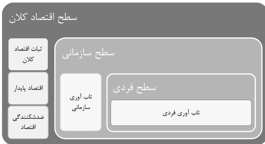
شکل ۳: طراحی مدل جامع حسابداری اقتصاد مقاومتی (پیغامی، ۱۳۹۶)

پس از بررسی مفهوم اقتصاد مقاومتی مشخص شد این عبارت با مفاهیمی از قبیل تاب‌آوری، ضد شکنندگی اقتصادی، اقتصاد پایداری و ثبات اقتصاد کلان مرتبط است (پیغامی، ۱۳۹۵) که از مهم‌ترین آنها «تاب‌آوری» ۱ است (پیغامی، ۱۳۹۴). از این رو، در این بخش به بررسی پژوهش‌هایی می‌پردازیم که در عرصه تاب‌آوری انجام شده است. گفتنی است پژوهش‌ها، تاب‌آوری را در سه سطح کلان (بین‌المللی / ملی / منطقه‌ای)، سازمانی و فردی مورد بررسی قرار داده‌اند. جهت نمایش ارتباط این سه سطح، می‌توان به مدل جامع حسابداری اقتصاد مقاومتی مطابق شکل ۳ اشاره نمود: